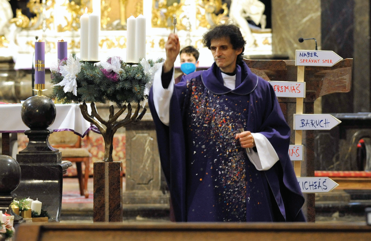
Detská svätá omša u piaristov na prvú adventnú nedeľu vysielaná online, 28. novembra 2021